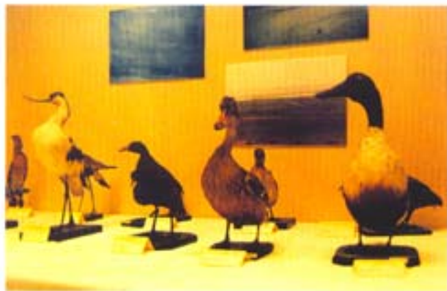
Sala central de Exposiciones del Centro Cultural Rio Héro del Ayuntamiento de Zaragoza